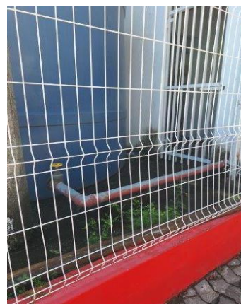
Foto 04 – Tubulação de incêndio no reservatório inferior existente.